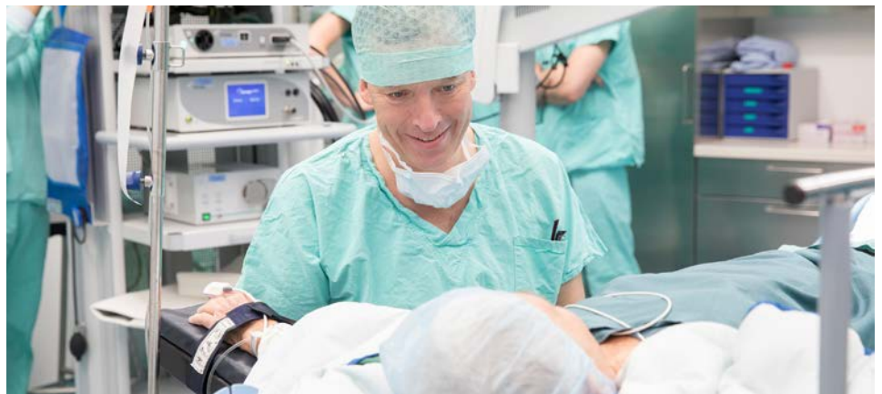
Gemeinsam am Weg zu den Fachkliniken der Vinzengruppe

Spezialisierungen sind ein bedeutender Trend im Gesundheitswesen. Krankenhäuser werden immer mehr zu Fachkliniken mit hoher Expertise, in denen spezialisierte Versorgung gebündelt wird.